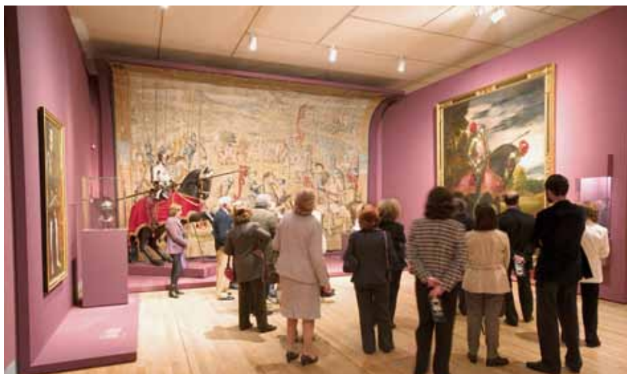
Visita de Miembros de Honor a El arte del poder. La Real Armería y el retrato de corte