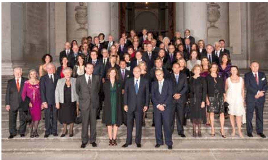
IV Encuentro de Patronos Internacionales