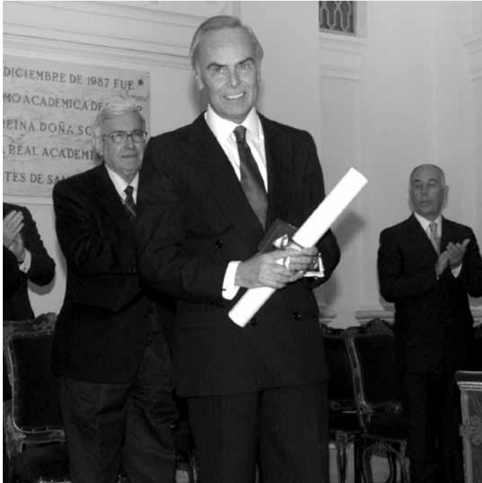
Premio Medalla de Honor 2003 de la Real Academia de Bellas Artes de San Fernando a la Fundación Amigos del Museo del Prado