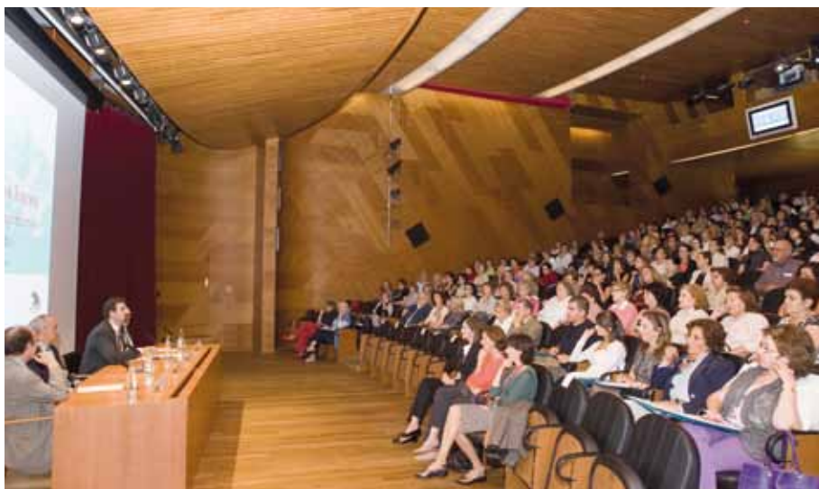
Ciclo anual de conferencias El arte del siglo de las luces. Las fuentes del arte contemporáneo a través del Museo del Prado