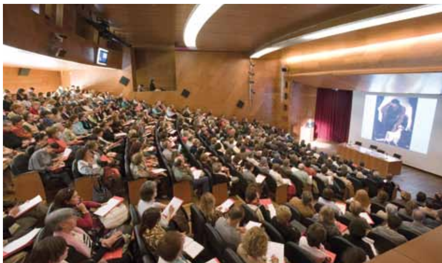
Ciclo anual de conferencias Los dioses cautivos. Mitología en el Museo del Prado