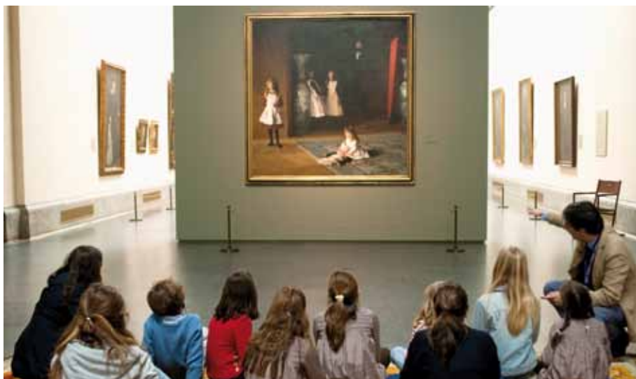
Alfombra mágica, visita a la “Obra invitada” Las hijas de Edward Darley Boit de John Singer Sargent