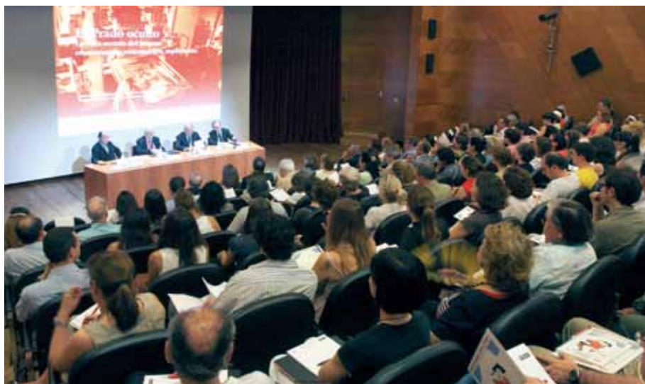
Curso de verano en colaboración con la UCM, El Prado oculto . La vida secreta del museo: conservación, restauración, replicación