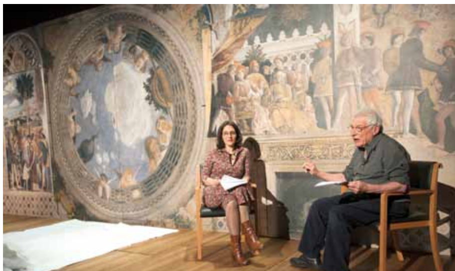
Homenaje al escritor John Berger