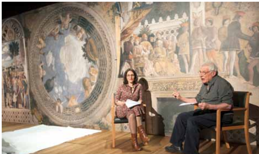
Homenaje al escritor John Berger