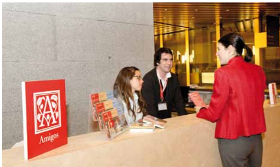
Mesa informativa de la Fundación en el Museo